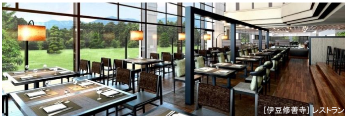
[伊豆修善寺] レストラン

開放感あふれる森のダイニングには樹のマテリアルや木漏れ日の情景など伊豆の森を表現した癒しの空間が広がります。お部屋は露天風呂付客室をはじめ、和洋室、ドッグフレンドリールームなどご滞在スタイルに合わせてお選びいただけます。