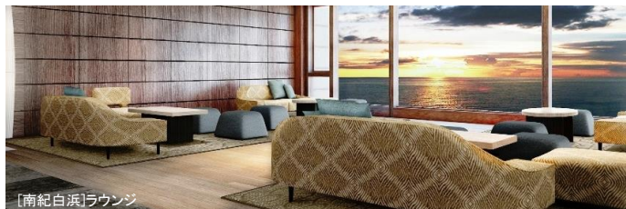
[南紀白浜] ラウンジ

太平洋を見渡す絶好のロケーション。コバルトブルーの海や空、白い砂浜など白浜の美しい情景を表現したゲストルーム。名湯・白浜温泉を引き込んだ温泉付客室や展望露天風呂でのひととき。お料理は新鮮なシーフードなどをお楽しみください。